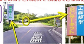
雲谷ホーム看板目印

(サーキット(設備)販売はしておりません。) ☆レースのある日はレース終了後からの利用になりますのでご了承ください。14時~5時