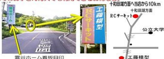
雲谷ホーム看板目印

(サーキット(印刷)販売はしていません。) ☆レースのある日はレース終了後からの利用になりますのでご了承ください。14時くらいから